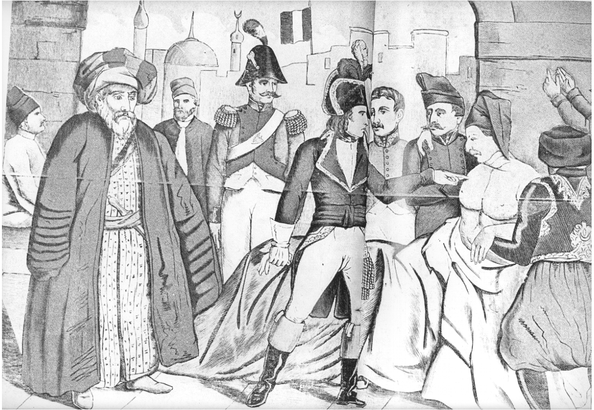
Bonaparte touchant les Pestiférés (Image d'Epinal)