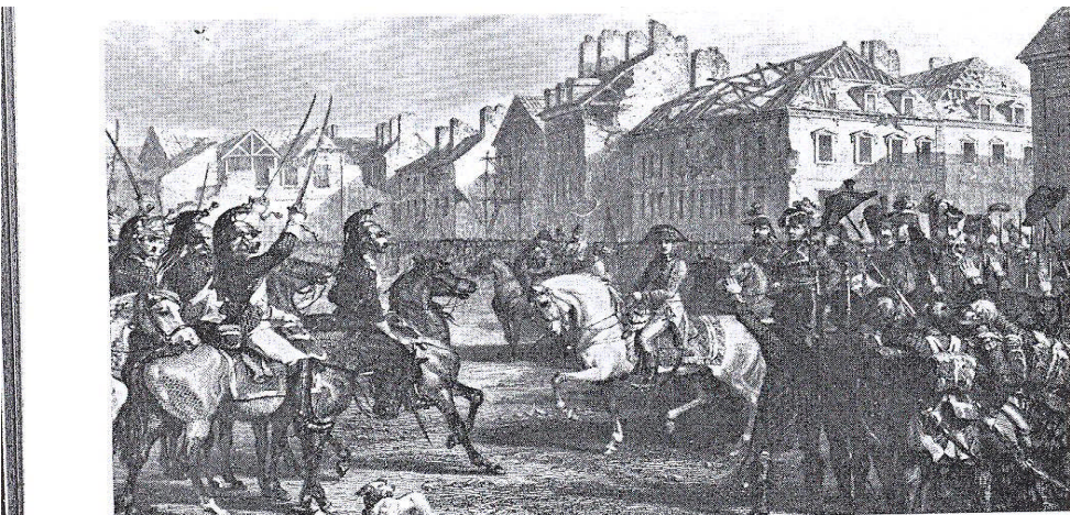
Revue à Lyon, de l'armée d'Égypte, 1798 (Gravure d'après Girardet)